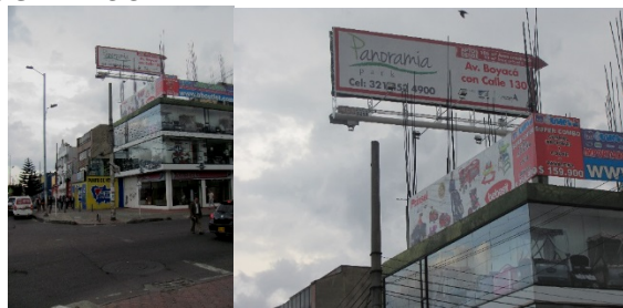
VALLA INSTALADA ANUNCIA SENTIDO NORTE – SUR : PARONAMIA PARK